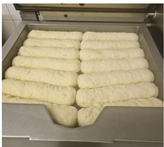
7. hotové vydáváme