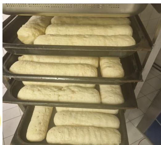
A JE TO