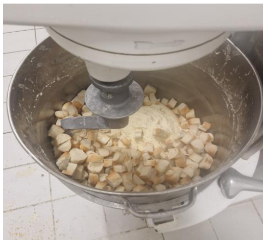
2. přidáme krutóny a hnětíme