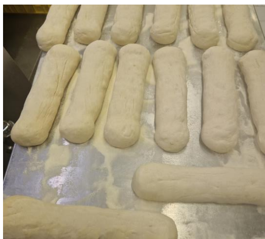
5. vyválíme knedlíky