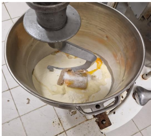
1. do kotle dáme všechny suroviny