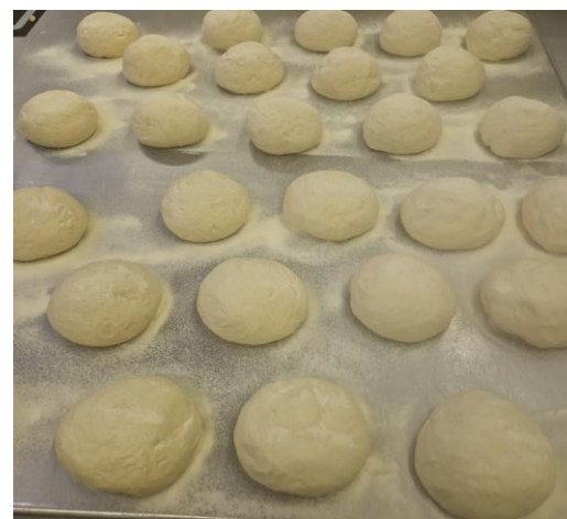
4. uděláme bochánky